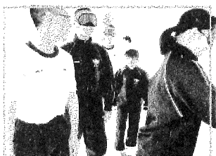
アイマスク体験中